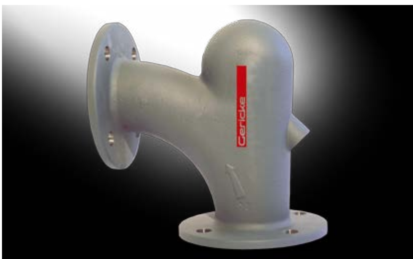
Avec coude Gericke

Grâce à une expérience positive de longue date et aux constats de la section de recherche, la fonderie Fritz Winter s'est prononcée en faveur du coude Gericke GB. Pour une plus grande unité, les pipes et les coudes de déviations seront remplacés par des coudes GB dans les trois domaines de production de moulages en sable pour blocs-moteur, plaquettes de frein et applications spéciales.