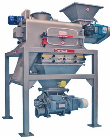
Tamiseur centrifuge avec séparateur magnétique et vanne rotative de décharge

Les tamiseurs centrifuges Gericke sont souvent combinés avec des installations d'extraction dans la meunerie. Soit connectés avec des vannes rotatives au niveau de la conduite de refoulement, soit intégrés directement dans le flux produit comme tamiseur inline. Les appareils conviennent aux installations de pression et d'aspiration.