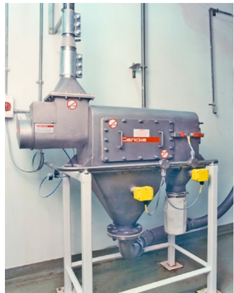
Tamiseur centrifuge Gericke

Pour de plus amples informations sur nos produits, services, distributeurs ou autres, consultez notre site www.gericke.net